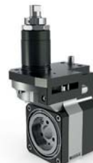
S205 / 206