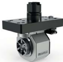
BH20 / BH20Z / BH38